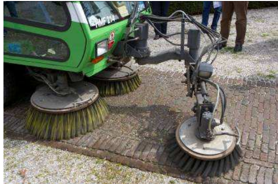
Figuur 8. Borstelmachine met extra onkruidborstel.