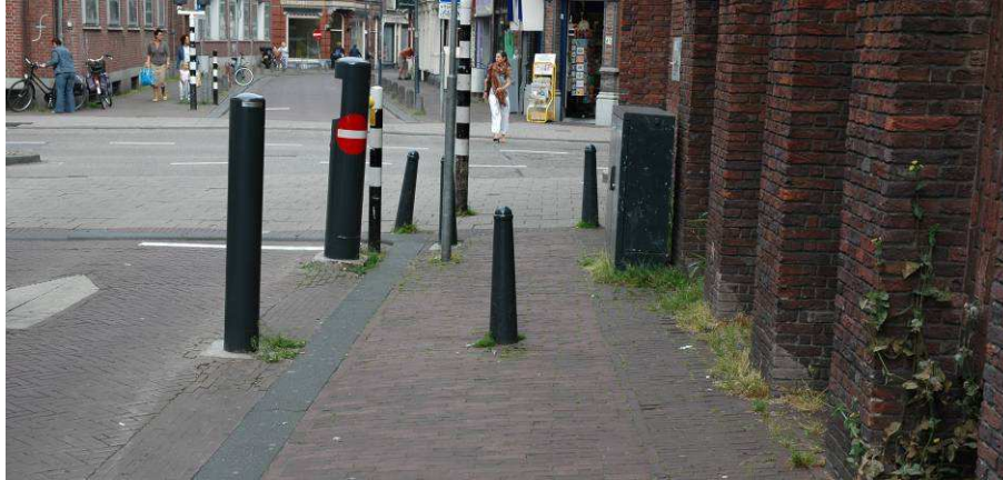
Figuur 3. Talrijke afzet- en anti-parkeerpaaltjes bemoeilijken het beheer