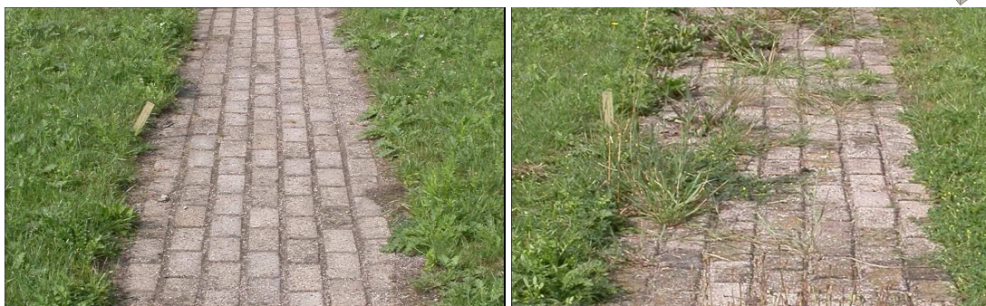
Figuur 5. Voorbeeld van klinkers met voegvulling (links) en klinkers met een standaard brekerzand voegvulling (rechts), twee jaar na aanleg

Wanneer het aanbrengen van een voegvulling overwogen wordt, is het van belang om vooraf een aantal zaken op een rijtje te zetten: