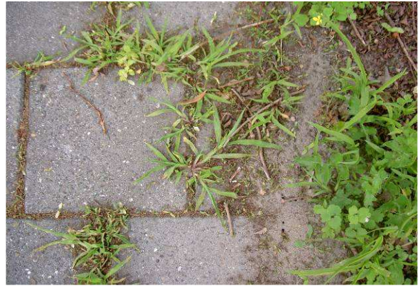
Figuur 9. Vuil vormt een voedingsbodem voor onkruiden.