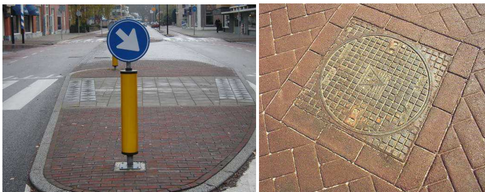
Figuur 7. Voorbeeld van voegvulling (links) op een verkeersheuvel en asfaltprint (rechts) in keperverband rond putdeksel (streetprint®)

Bij de aanleg van open verhardingen kunnen ook producten gebruikt worden waarbij de in- en doorgroei van onkruiden minder en trager verloopt dan bij andere open verhardingen, bijvoorbeeld schelpen. Bij open verhardingen van sintels, grind of schelpen is het periodiek aanbrengen van nieuw materiaal noodzakelijk om de groei van onkruiden te beheersen.