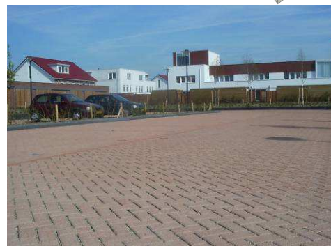
Figuur 2. Voorbeeld van verharding met een waterdoorlatende functie middels een lavapakket onder de verharding

Houd bij het ontwerp van de openbare ruimte rekening met de plaatsing van obstakels. Plaats obstakels zoals verkeersborden, fietsenstallingen en afvalbakken zo veel mogelijk in groenstroken. Dit voorkomt een storend beeld rondom deze objecten. Immers: plantengroei (onkruid) rondom een object dat in een groenstrook is geplaatst, valt veel minder op dan onkruidgroei rondom hetzelfde obstakel wanneer het geplaatst is op een verharding.